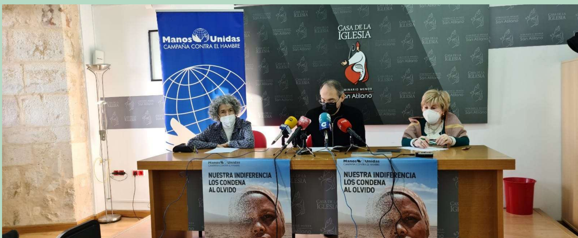
Manos Unidas presenta la campaña contra el hambre