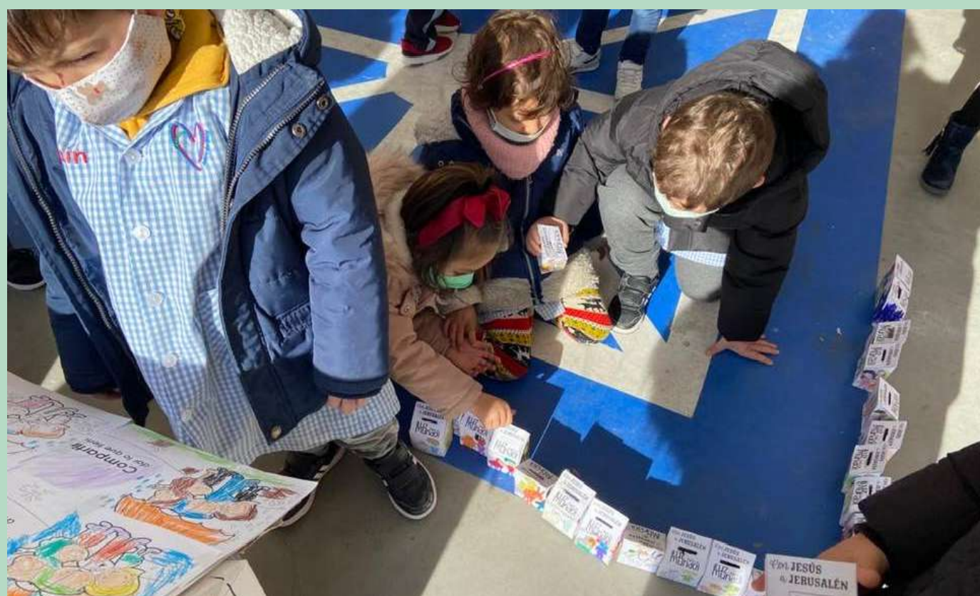
El colegio "Amor de Dios" de Pinilla celebra la Infancia Misionera