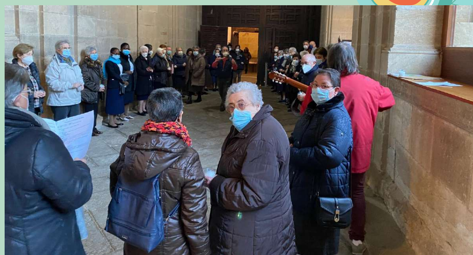
Jornada de la Vida Consagrada