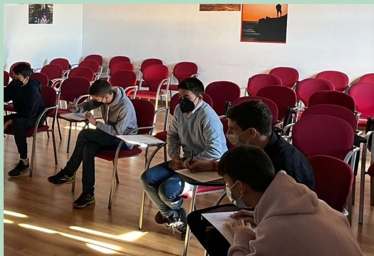
Convivencia en el Seminario 5 y 6 de febrero nueva convocatoria