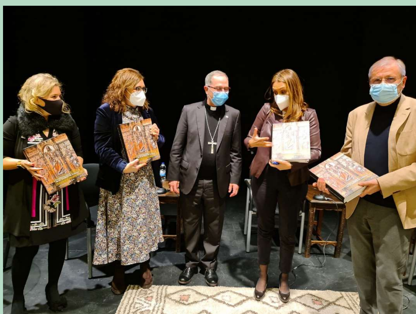
Mesa de Amistad Social: Los Medios de Comunicación