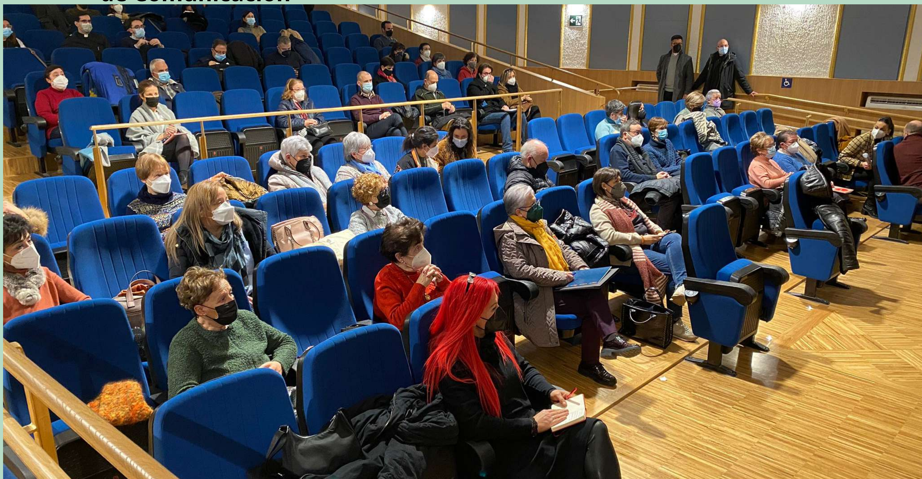
Jornada formativa de los coordinadores del Sínodo