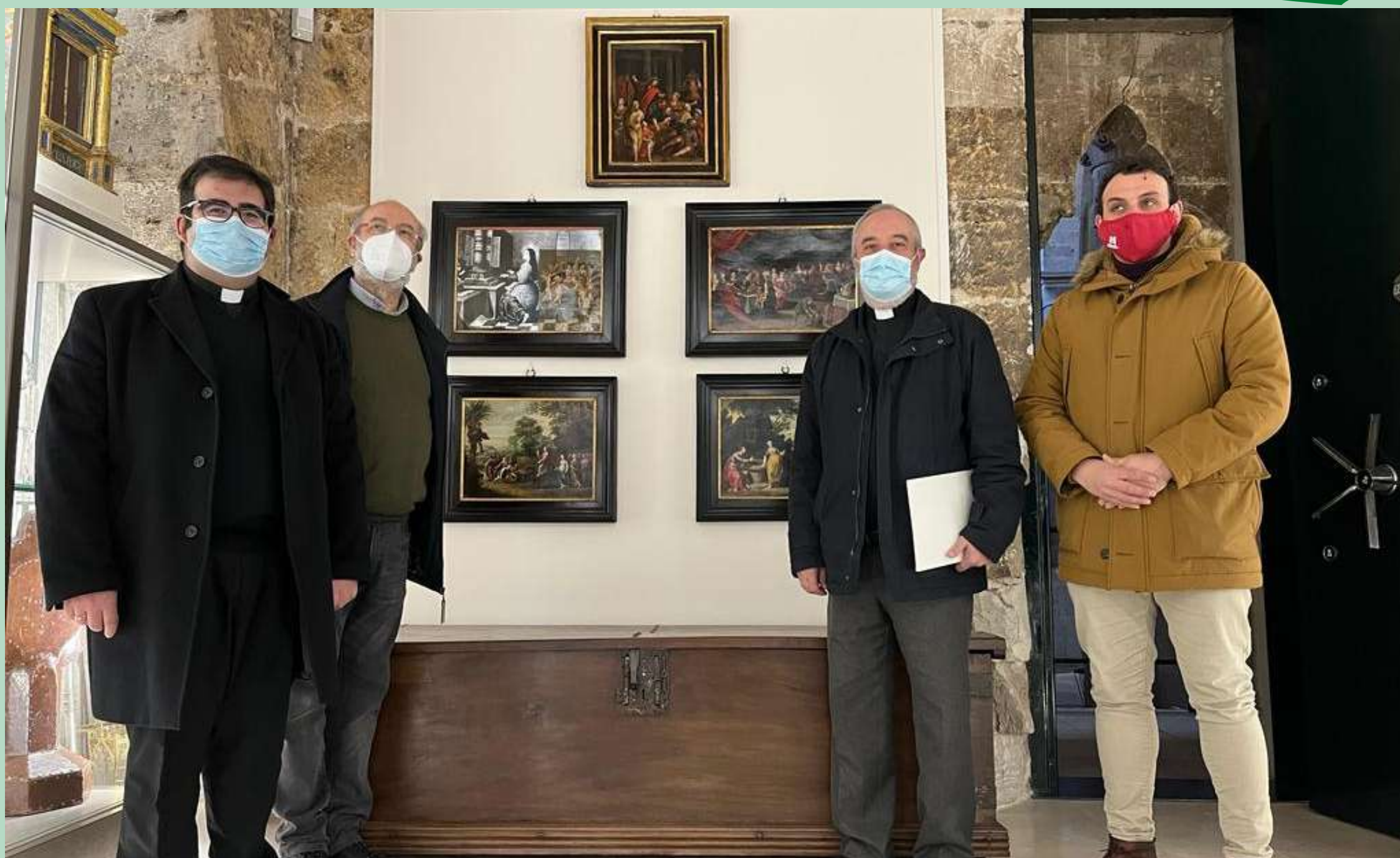
Presentación de los cobres robados en La Colegiata de Toro