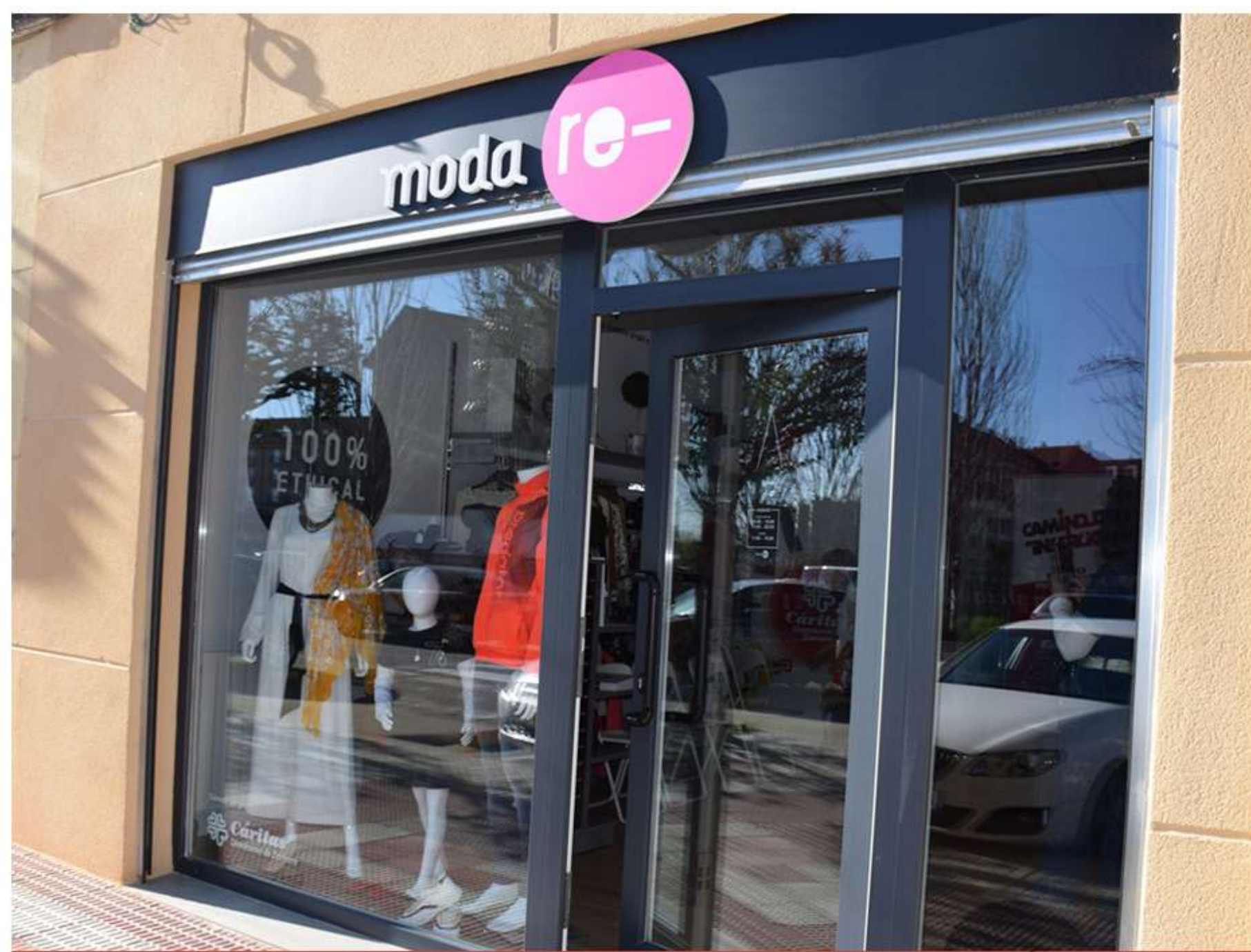
Fachada de la tienda de Moda re- en Benavente

El proyecto textil “Moda re-” ya es una realidad en Benavente. El objetivo principal de este proyecto es la creación de empleo social y sostenible, la transparencia, el destino ético de las prendas y el consumo responsable.