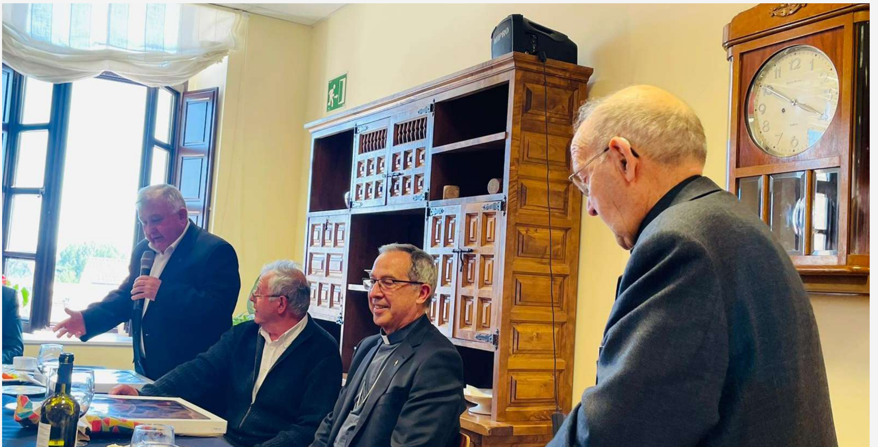
Comida homenaje a los sacerdotes en el Seminario San Atilano