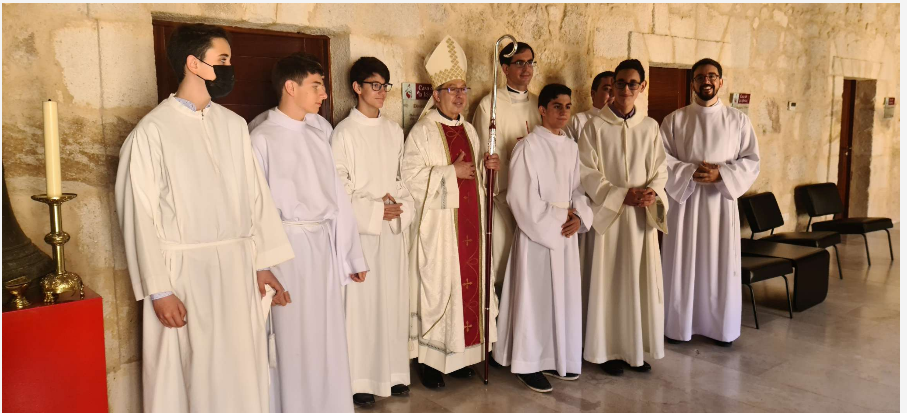
El obispo Fernando Valera acompañado de los seminaristas mayores y menores de la diócesis de Zamora