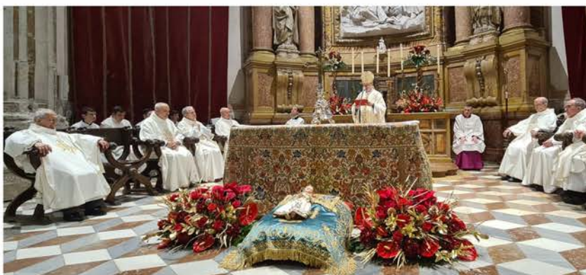
Misa de Navidad