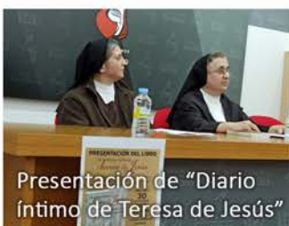
Presentación de "Diario íntimo de Teresa de Jesús"