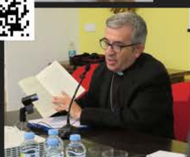
Encuentro anual de diáconos permanentes (Zamora)

¿CÓMO EVANGELIZAR EN LA SOCIEDAD ACTUAL? UN CAMBIO DE ÉPOCA