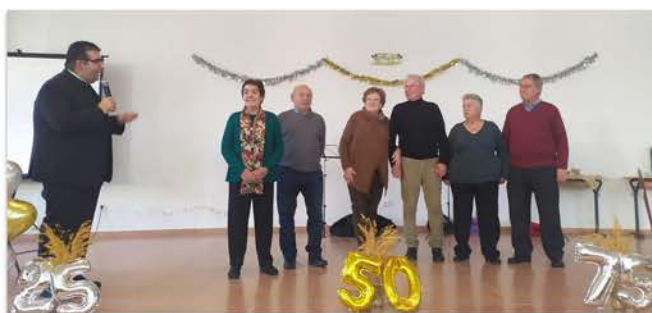
Aniversarios de matrimonio en Sayago