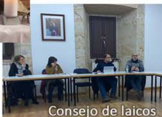
Consejo de laicos