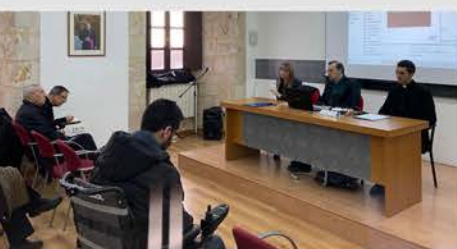
Conferencia Pastoral de la Salud