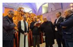
Bendición del Belén en el Tránsito

La Fundación de Christus Yacens , distribuye 600 bolsas de alimentos