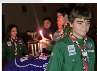
Luz de la Paz de Belén