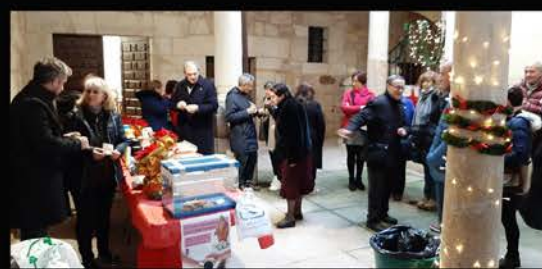
III Café Solidario Cofradía Luz y Vida