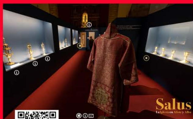
Visita virtual a Salus