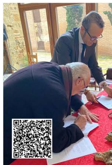
Convenio con ayuntamiento de Villalpando

Mercadillo navideño de Manos Unidas en el Seminario con juguetes, bisutería, bolsos y elementos de decoración. Se mantendrá abierto en el tiempo de Navidad.