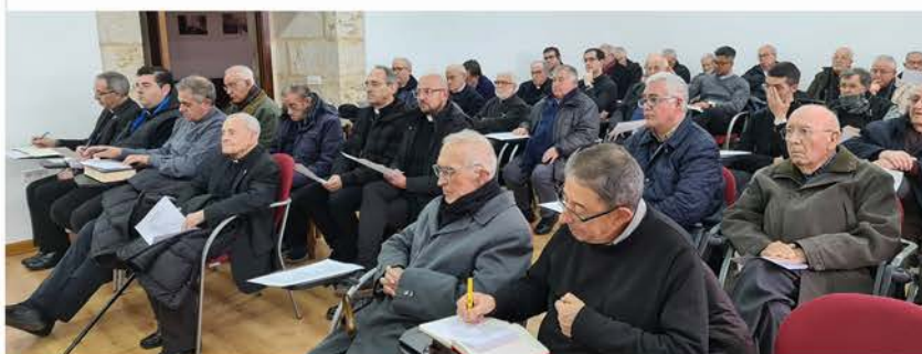
Reiro de sacerdotes