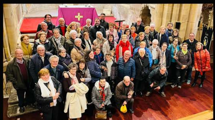
Parroquias de Riego, Granja, Manganeses y Villalba