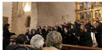
Concierto Sto. Tomás (Toro)