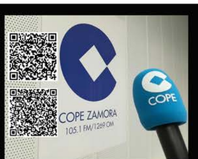
Programas de radio