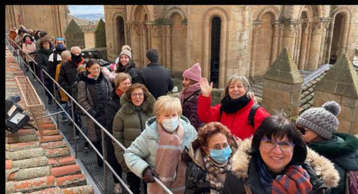
Convivencia U.P. El Buen Pastor