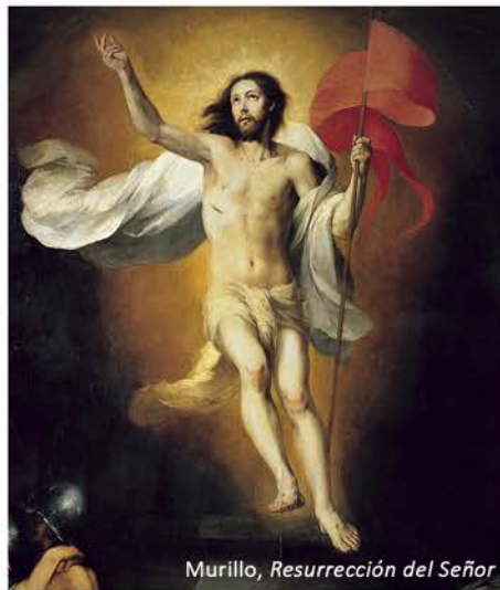
Murillo, Resurrección del Señor

la muerte se refiere a uno y vida a otro. – Pero el texto enseña: “Yo hiero y yo mismo sano” (Dt 32,39): como herida y curación hacen referencia a la misma persona, de igual manera muerte y vida harán referencia a la misma persona.