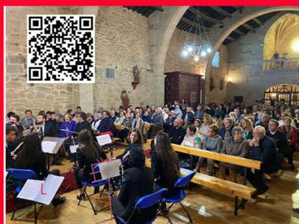
Concierto en Villar del Buey