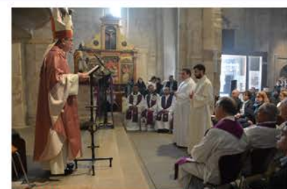
Admisión a sôgradas ôrdenes