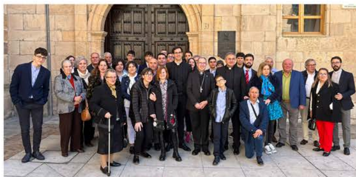
Día del Seminario