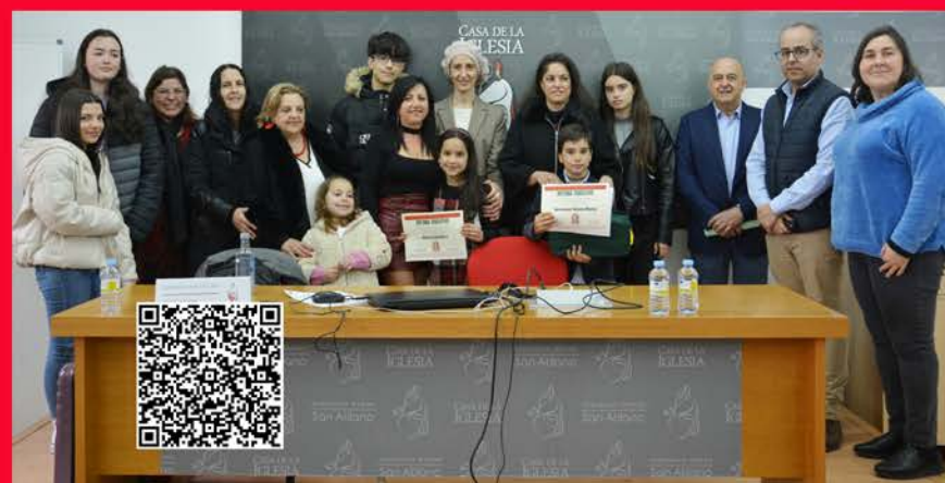
Entrega de premios de la delegación diocesana de enseñanza