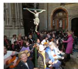
Peregrinación U.P. Zamora Noroeste