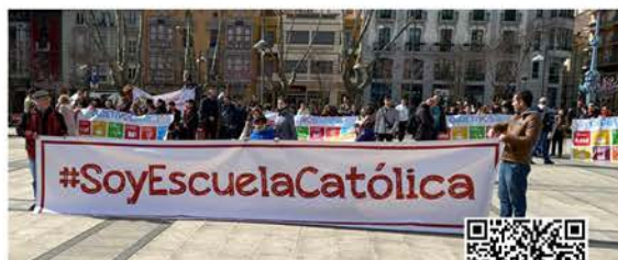
Por una escuela plural y libre