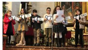
Parroq. Carmen (Benavente)