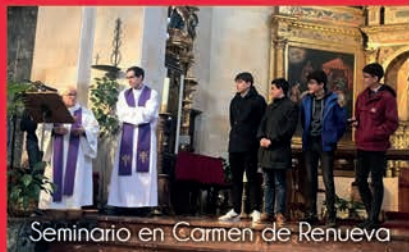
Seminario en Carmen de Renueva