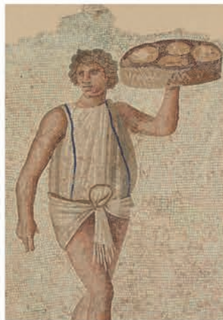
Espartaco: símbolo de la libertad

Querido lector: Hoy te invito a conocer una de las palabras hebreas más cargada de hondos significados tanto para el judaísmo como para el cristianismo. La raíz verbal ga'al es exclusiva del hebreo entre las lenguas semíticas. Pasó como hebraísmo al samaritano y como herencia propia al judaísmo postbíblico. En la literatura postbíblica aparece en el Documento de Damasco 14,16, como participio go'el con el sentido de "pariente próximo". De la raíz verbal deriva el nombre abstracto ge'uláh , forma nominal típica del ámbito jurídico: derecho y obligación a la liberación, al rescate. En 118 ocasiones aparece ga'al en el AT y 46 veces el participio go'el , siempre sustantivado, excepto en Gn 48,16 y Sal 103,4. La expresión go'el