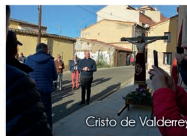
Cristo de Valderrey