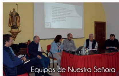
Equipos de Nuestra Señora