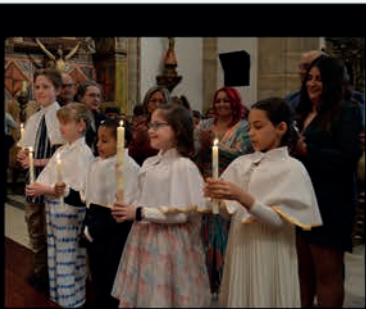
Bautismos en El Buen Pastor