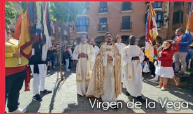
Virgen de la Vega