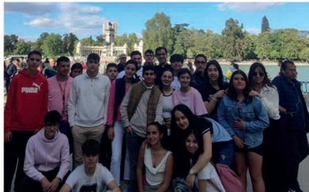
Fiesta de la Resurrección