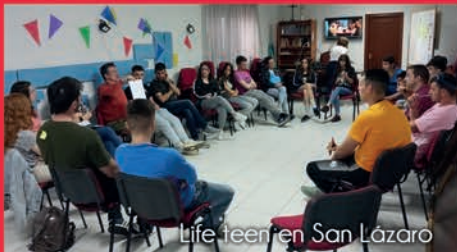
Life team en San Lázaro