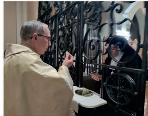
Despedida de las Marinas