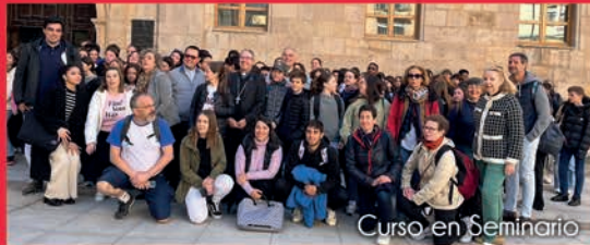
Curso en Seminario