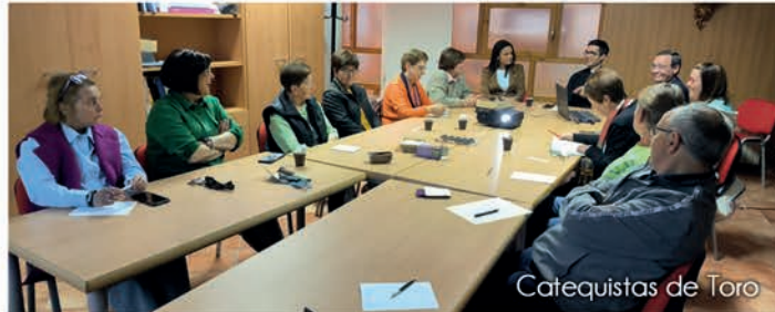
Catequistas de Toro