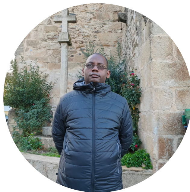
Principius (Tanzania), en Aliste-Alba