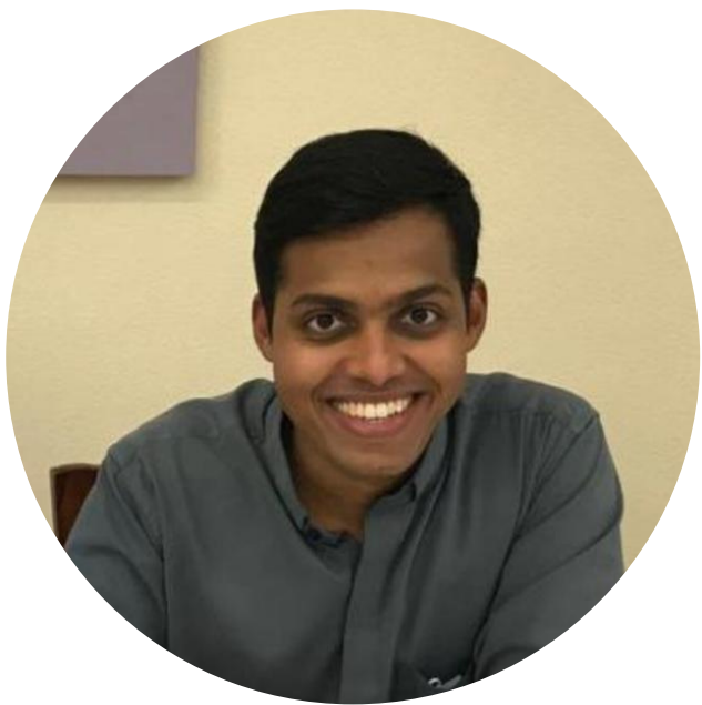
Ajai (India), en Benavente

La diócesis acoge a ocho sacerdotes venidos de África, de América Latina y de India. El objetivo es ayudarlos en su formación y que puedan realizar una experiencia pastoral en nuestra diócesis