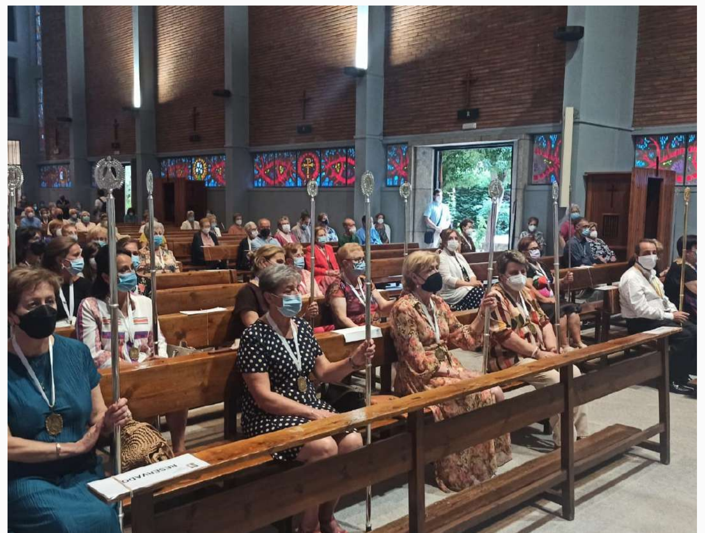
Festividad de la Virgen de la Peña de Francia en el día de la natividad de la Virgen María