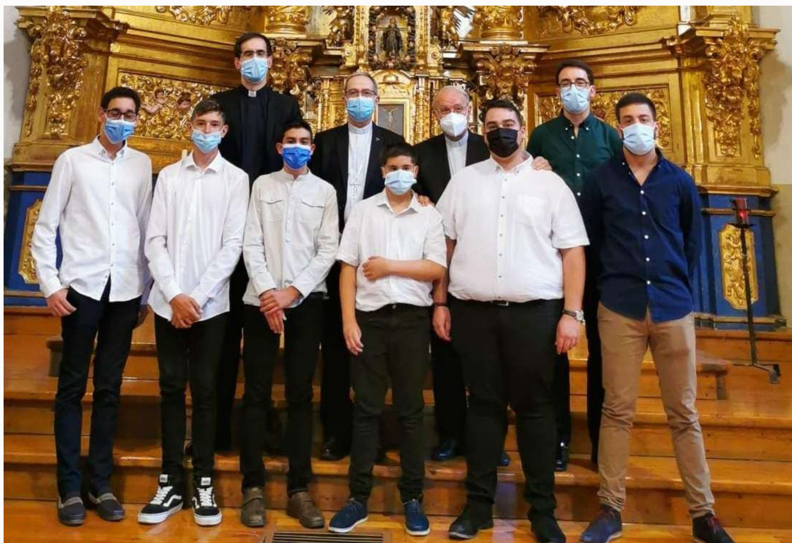
Los seminaristas menores y mayores de la diócesis inician el curso con una eucaristía en la iglesia de San Andrés

En el año 2001 es nombrado vicario parroquial de Cristo Rey en Zamora, parroquia a la que siguió vinculado hasta su fallecimiento; puesto que en el año 2004 se jubiló canónicamente y pasó a ser vicario parroquial emérito.